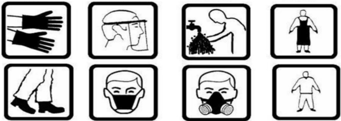
Picha Na. 7. Vifaa vya kujikinga wakati wa kunyunyiza viuatilifu