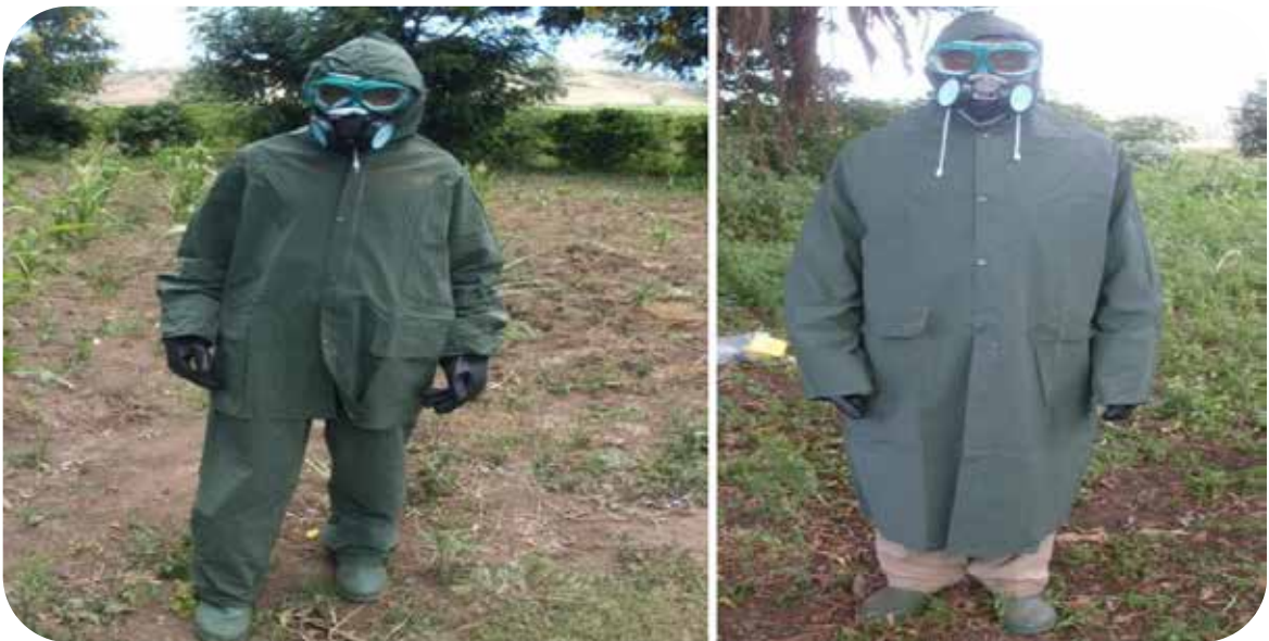
Picha Na. 8. Namna mnyunyiziaji wa viuatilifu anavyotakiwa kuvaa