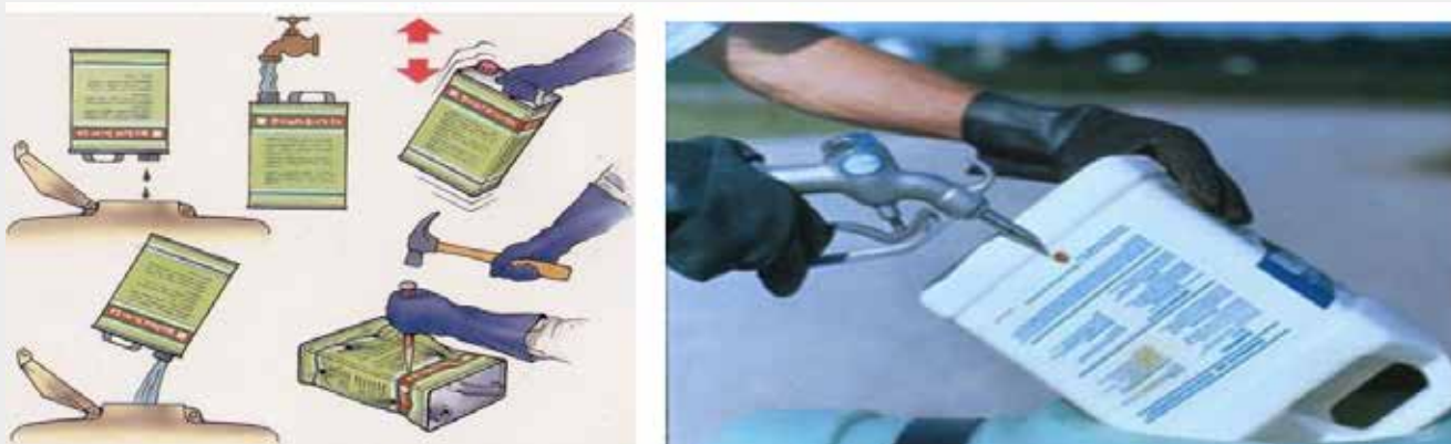
Picha Na. 5: Namna ya kutoboa vifungashio vya viuatilifu