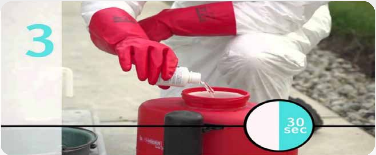
Picha Na : Uchanganyaji salama wa viuatilifu